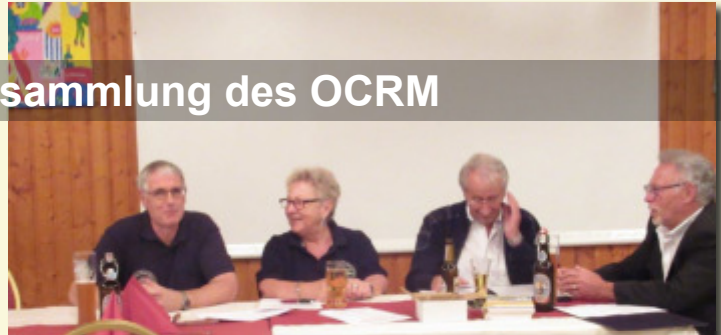
...und die Bilder dazu von Wolfgang Hannappel